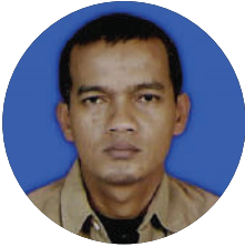
Arie Basuki MERDEKA.com

Saat ini bekerja sebagai fotografer di Merdeka.com