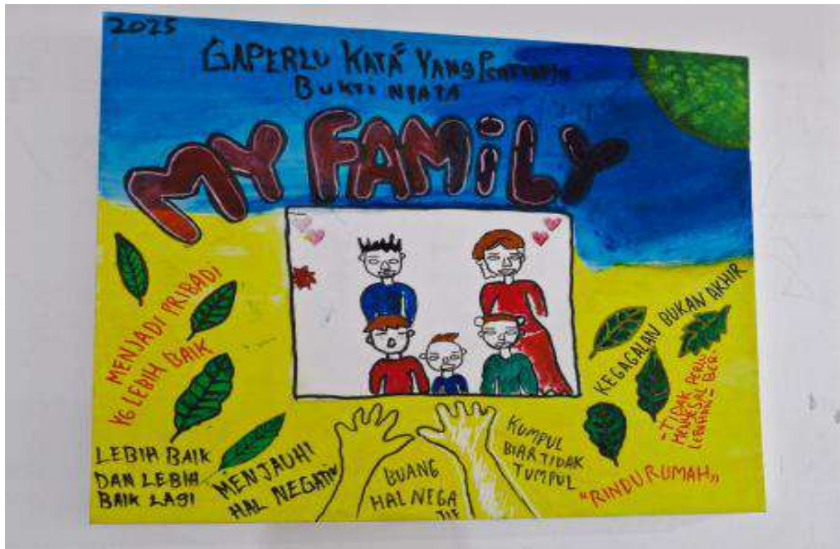
Contoh karya seni lukis salah satu anak berhadapan dengan hukum (ABH) di LPKA Jakarta.

Bahkan, ada anak yang pernah mencoba melarikan diri karena tekanan yang mereka rasakan.