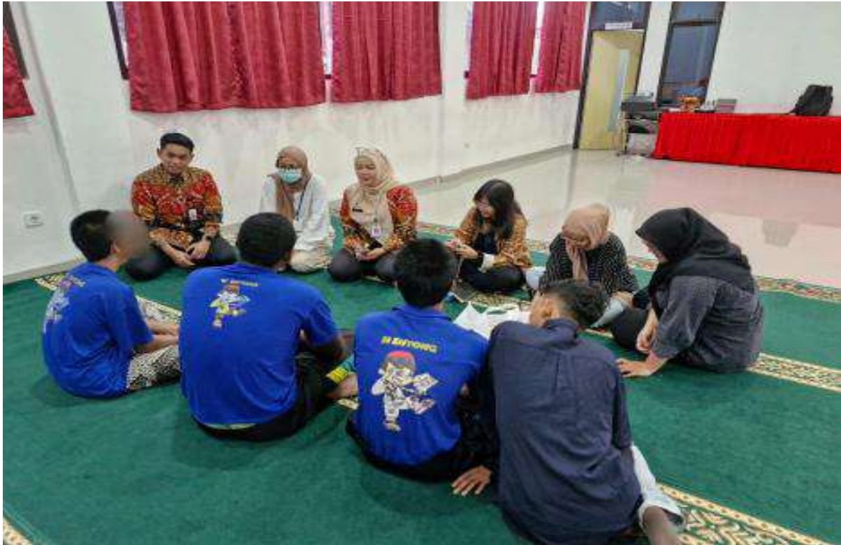
Dialog Prohealth.id dengan ABH di LPKA Jakarta.