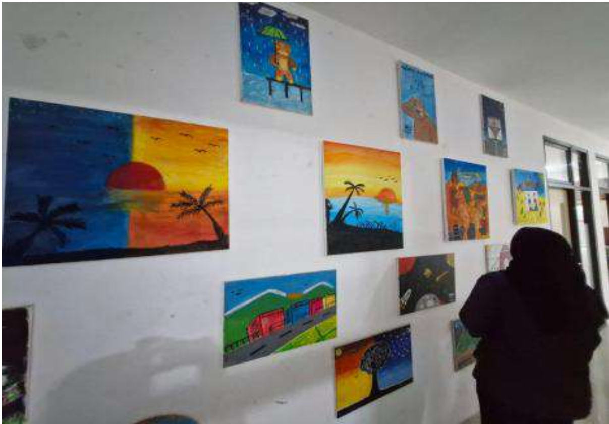
Kumpulan karya anak berhadapan dengan hukum (ABH) di LPKA Jakarta.

Lebih dari sekadar keterbatasan gerak, ia merasakan kehilangan yang dalam. "Kangen keluarga. Ketemu cuma 30 menit. Dulu bisa sering ketemu, sekarang rasanya berat banget. Telepon di sini juga gantian, sesuai abjad, dibatasi 20 menit, rasanya kayak 5 menit," ujarnya.